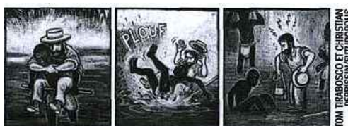
TOM TIRABOSCO ET CHRISTIAN PERRISSIN/FUTUROPOLIS

Malgré sa riche expérience antérieure, notamment en Asie, Joseph Conrad s'embarque pour l'Afrique à reculons, par nécessité économique. Tout juste est-il conforté par l'affection qu'il porte à une tante récemment retrouvée, avec laquelle il entretient une correspondance soutenue. Ses appréhensions se confirment très vite. La plupart des Blancs qu'il rencontre dans la colonie belge sont des brutes sans scrupule.